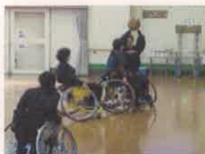
車いすバスケットボール

バスケットコート 1面 バレーボールコート 1面 バドミントンコート 3面 卓球台 9台 視覚障がい者用卓球台 2台