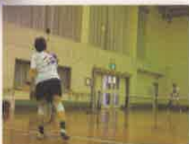
視覚障がい者テニス